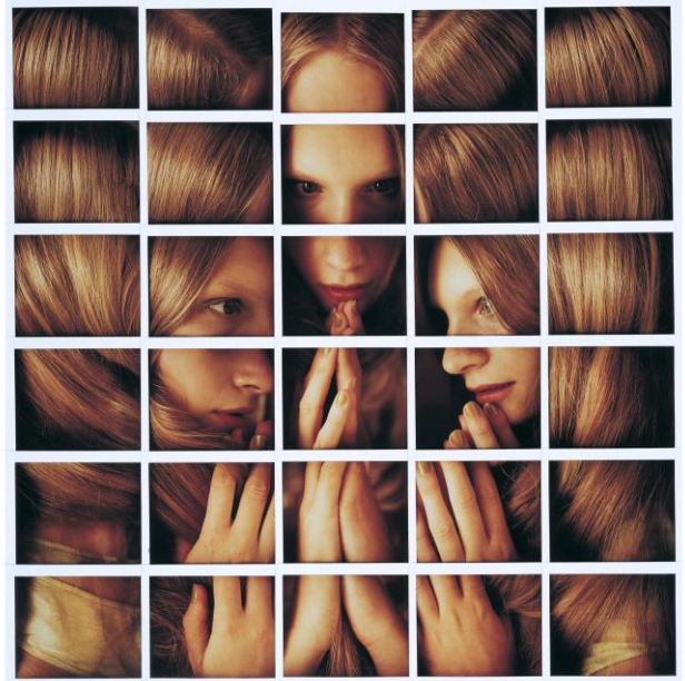
Agata Buzek, 1998, Museo Polacco Szeged