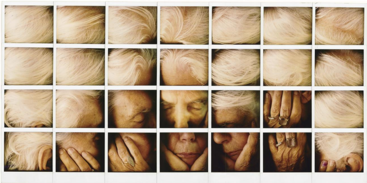
Lalla Romano, 1994, Mosaic Polaroid Image