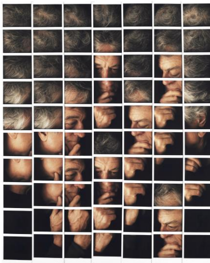
by Maurizio Galambosi