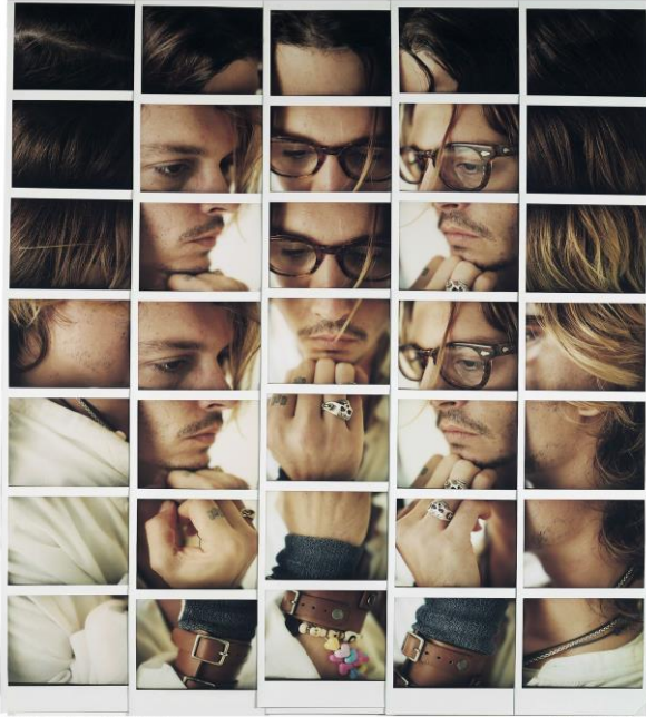
Johnny Depp, 2003, Museo Polacco Szeged