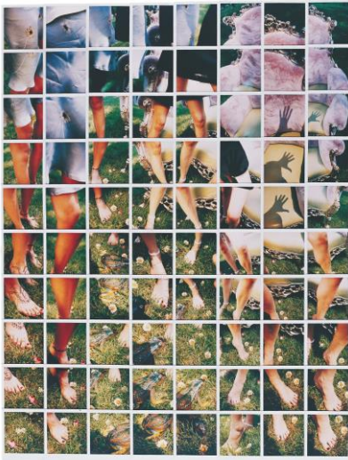
by Maurizio Galambosi