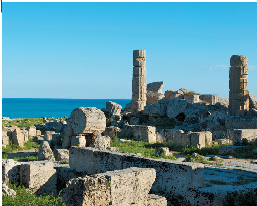
SELINON. In alto, i blocchi delle colonne templari ormai distrutte, del Parco archeologico di Selinunte, uno dei parchi più grandi del mondo, dove resiste eretto solo il Tempio di Hera, nella foto a destra

e, forse, solo oggi è possibile percepire una maggiore tutela da parte di un'amministrazione sempre più vigile a nuove "iniziative" di questo tipo.